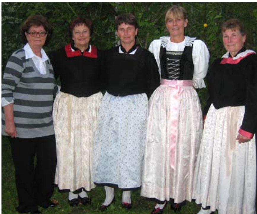
Selbst genäht: einige Andrianer Bäuerinnen in ihrer Tracht.