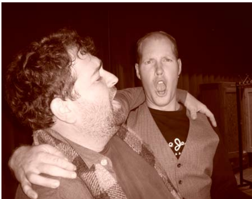
Es wird schon fleißig geprobt für „Othello darf nicht platzen“.

Im Jahre 2000 wurde dann die Kriminalkomödie „Wer erstach den armen Henry“ aufgeführt. Der feine englische Humor zog sich wie ein roter Faden durch die Abende. 2001 entschieden wir uns hingegen für die