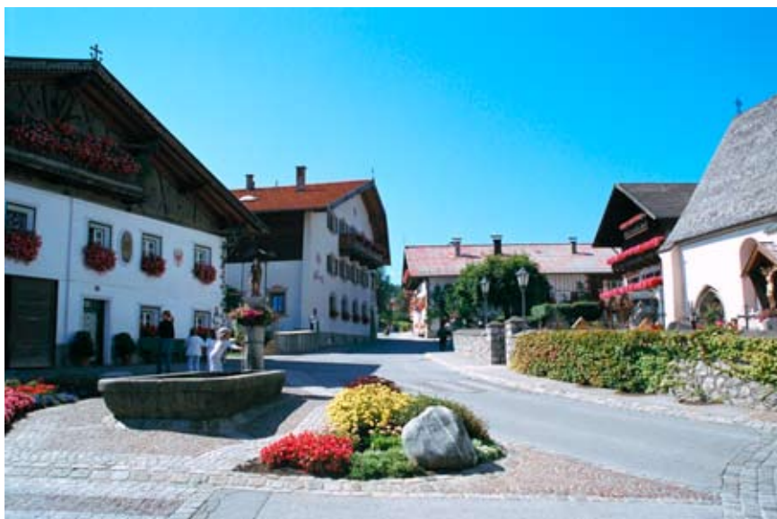
Mutters in Nordtirol: Die Partnergemeinde ist ähnlich strukturiert wie Andrian.

Mit einem feierlichen Festakt in Andrian und unter reger Teilnahme der Mutterer Vereine und Gemeindeglieder wurde am 24. November 1984 die seit Jahresbeginn vorbereitete Gemeindefreundschaft von