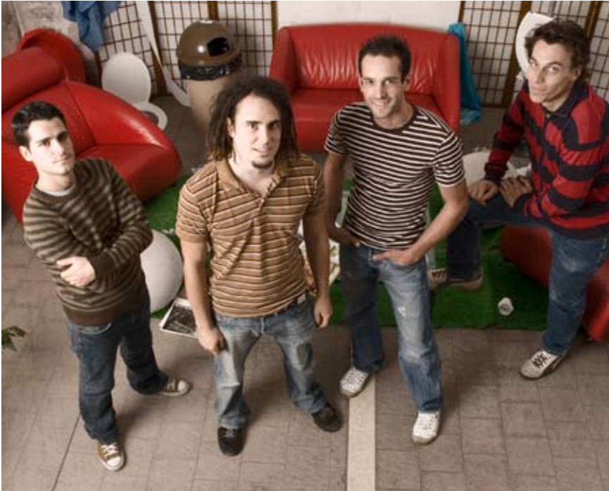
Rockig unterwegs: die Gruppe Killjoy